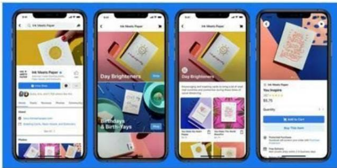
Facebook Shops will allow sellers to create digital storefronts on Facebook or Instagram

„Facebook Shops“ ermöglichen jedem Verkäufer die Werbung über digitale Schaufenster auf Facebook oder Instagram.